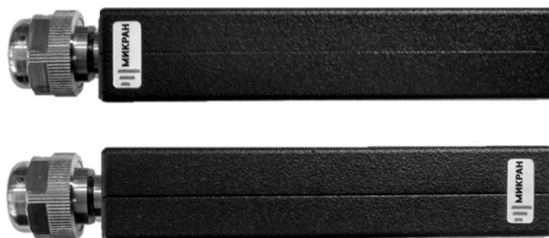
Рисунок 3 – Места пломбировки от несанкционированного доступа