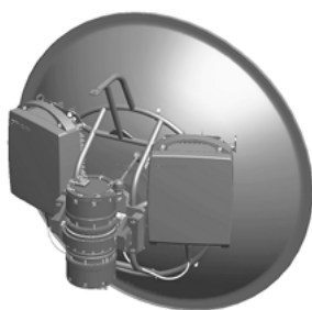
МИК-АПУ с установленной антенной