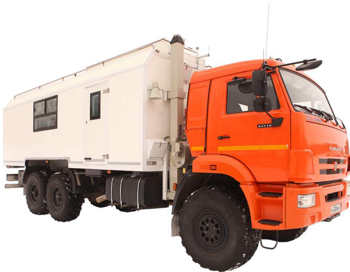
Подвижный пункт управления и связи (ПУС).